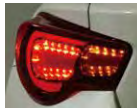
■LED テールランプ (TOM'S 製)