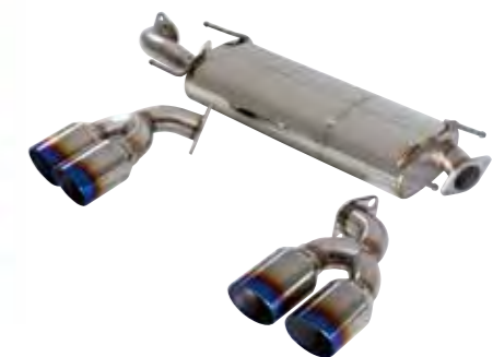
専用エキゾーストシステム