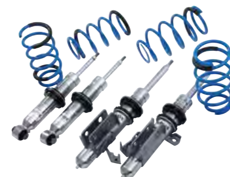
コイルダンパーユニット Advox (専用セッティング)

リアルスポーツに相応しいエンジン特性を追求した結果TEAM NetzはTOM'S製スーパーチャージャーの装着と専用エキゾーストシステムの開発を選択した。低回転域からの俊敏な加速、湧き出る様なトルク特性、水冷インタークーラーの採用による気温に左右されない安定性。更には電磁クラッチを装着する事により静寂性や省燃費性にも配慮した。専用エキゾーストシステムにおいては排気効率はもちろん、官能的なサウンドとチタンテールの採用による軽量化にもこだわった。追い求めたのは究極のドライビングプレジャーである。