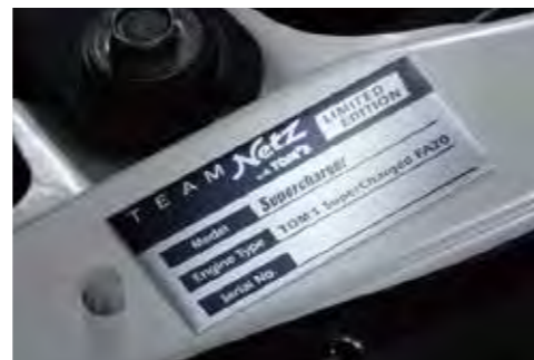
専用シリアルナンバープレート