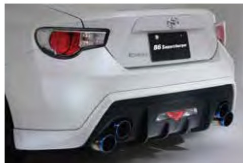
リアアンダースポイラー&専用エキゾーストシステム