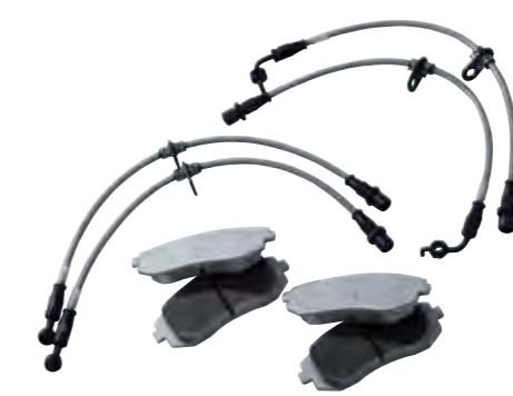
ブレーキライン&ブレーキパッド