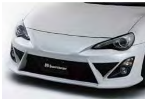
専用フロントバンパー

更にリミテッドモデルならではのプレミアム性を演出するべく、Superchargerエンブレム、ナンバリングされたシリアルプレートが装着される。リアルスポーツと呼ぶに相応しいスタイリングとステータスを完成させた。