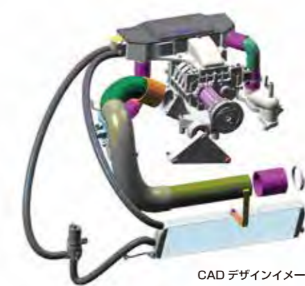
CAD デザインイメージ