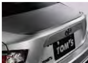
■トランクリッドスポイラー (TOM'S 製)