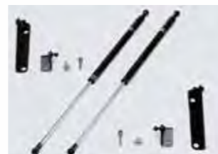
■ボンネットダンパー (TOM'S 製)