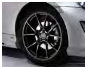
■18インチ鍛造アルミホイール (TWS 製) & タイヤセット