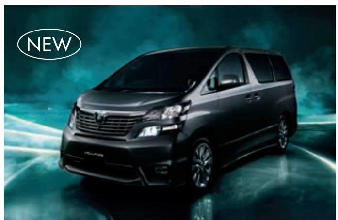
Photo:特別仕様車 2.4Z"PLATINUMセレクションII" 2WD. 車両本体価格 3,430,000円 (消費税込み) ボディカラーは特別設定色グレーメタリック。 ※その他グレードございます。

ALPINE BIG X [ビッグX] KTD-X088 VGY-R/GBY-R